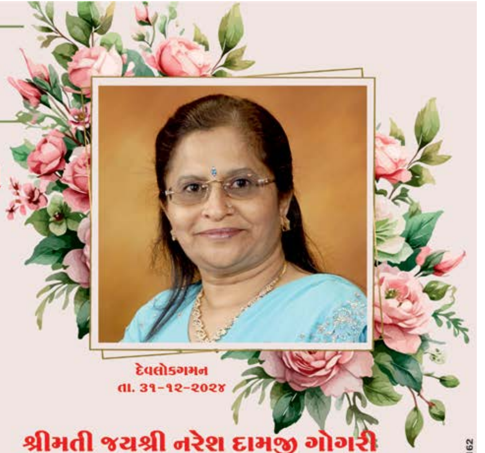
દેવલોડગમન તા. ૩૧-૧૨-૨૦૨૪