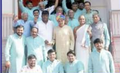
છેલ્લે આ પ્રસંગમાં કોઈ પણ ક્ષતિ રહી ગઈ હોય કે કોઈને તકલીફ થઈ હોય તો સર્વેનો હૃદયપૂર્વક મિત્રદામિ દુઃસ્વપ્ન માગીએ છીએ.