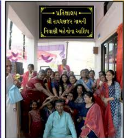
પ્રતિભાલય શ્રી રાયધણજર ગામની નિયાણી બહેનોના આશિષ