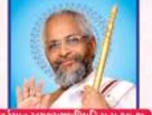
વર્તમાન અવલગચારિવિદી પ.પુ.આ.ભ. શ્રી કલ્યાણભાઈચૂરીચરક મ.સા.