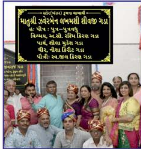
માતૃશ્રી ઝવેરબેન લખમશી શીવજી ગડા