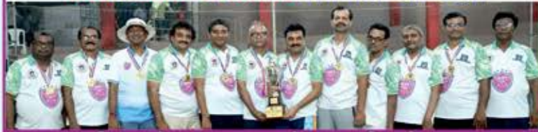
શ્રી ગુણોદય નગર સોસાયટી (કોટડા)