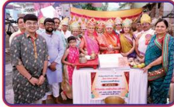
૪) શ્રી અગ્નિ શિલા શ્રી ઉત્તમચંદ રણશી હરીયા (ભોજાય) હસ્તે સરલા-હસમુખ, નીલમ-ભરત, આશા-કિરણ, ભારતી-સંજય