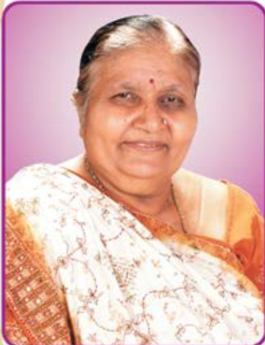
અરિહંતશરણ : તા. ૧૧.૬.૨૦૨૨