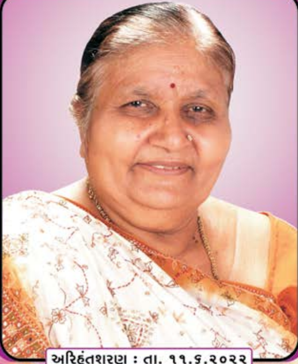
અરિહંતશરણ : તા. ૧૧.૬.૨૦૨૨