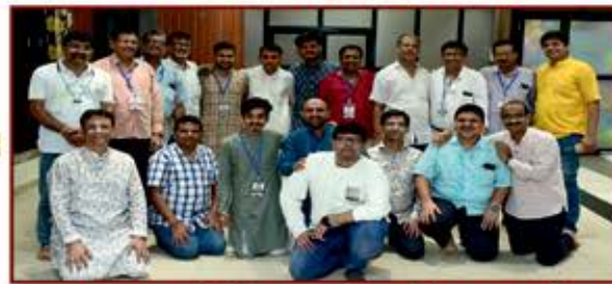
જગદુશા ચોવિહાર હાઉસની સમસ્ત ટીમ