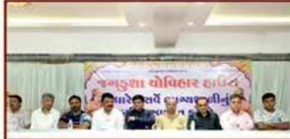
દાતા પરિવાર તથા આમંત્રિત મહેમાનો