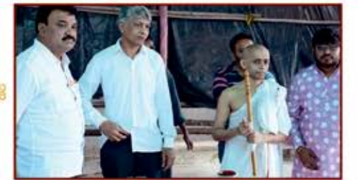
ચોવિહાર હાઉસને આશિષ પાઠવતા શ્રમણભગવંત