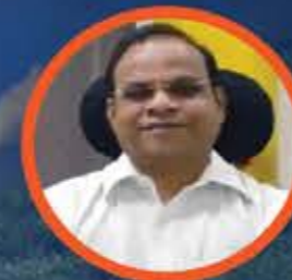
Shri Govind Bodke Collector and Magistrate of palghar District