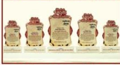
દાતા પરિવારના બહુમાનનું સંભારણું