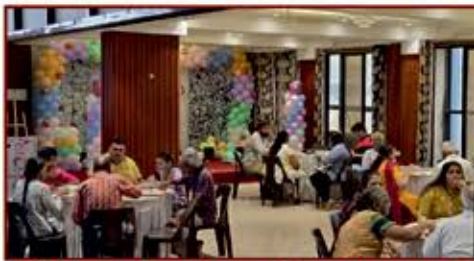
ચોવિહાર હાઉસનો લાભ લેનાર ભાગ્યશાળી