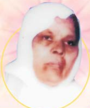
પ.પૂ. નરેન્દ્રશ્રીજી મ.સા.