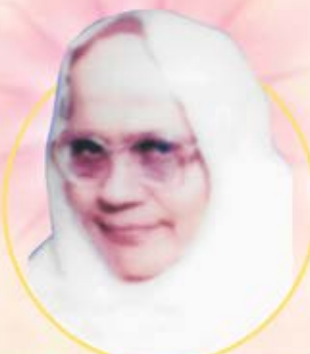
પ.પૂ. વિદ્યુતપ્રભાશ્રીજી મ.સા.

જેઓ સ્વધ્યાય ને પ્રભુભક્તિમાં મસ્ત હતા, ચારિત્રપાલનમાં જેઓ અટલ હતા.