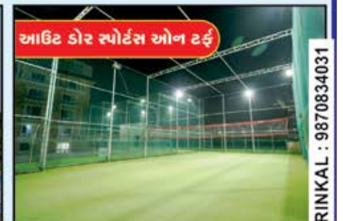
આઉટ ડોર સ્પોર્ટ્સ ઓન ટર્ફ