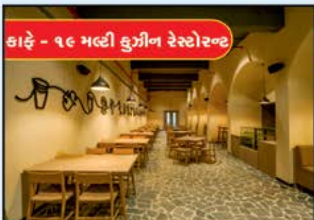
કાફે - ૧૯ મલ્ટી કુઝીન રેસ્ટોરન્ટ