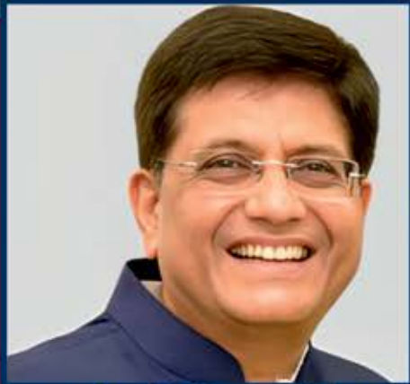
માનનીયશ્રી પિયુષ ગોયેલજી કેન્દ્રીય મંત્રી