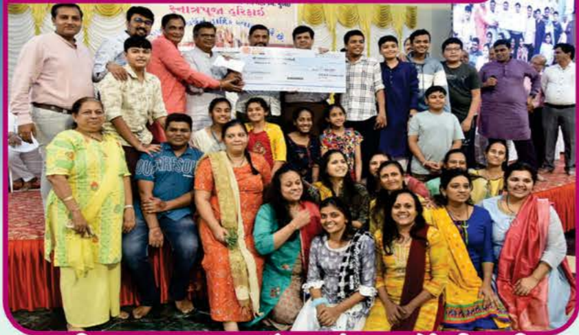
શ્રી અચલગચ્છ જૈન સંઘ - ડોંબીવલી

દ્વિતીય વિજેતા Price : 31000/- + 11000/-