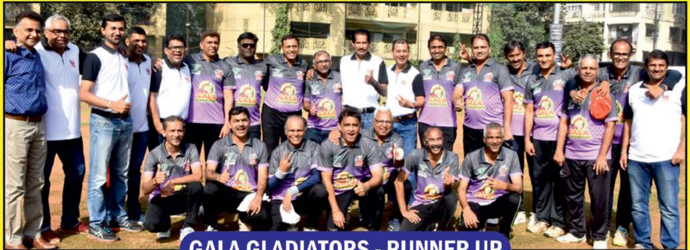
GALA GLADIATORS - RUNNER UP