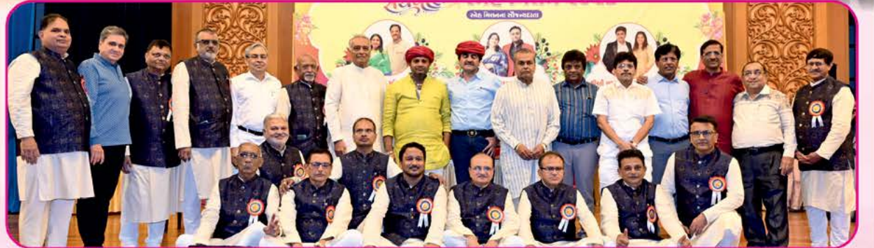
બેરાજા સ્નેહ મિલનને સફળ બનારનાર નિઃસ્વાર્થ સેવાભાવી ટીમ સાથે પ્રસંગી શોભા વધારનાર માનવંતા મહેમાનો...