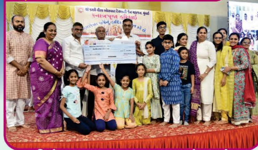
શ્રી હૈદરાબાદ અચલગચ્છ જૈન સંઘ

દ્વિતીય વિજેતા Price : 31000/- + 11000/-