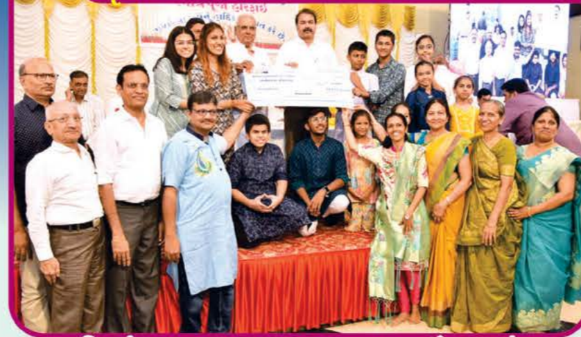
શ્રી પંતનગર અચલગચ્છ જૈન સંઘ

સ્નાત્ર પૂજા હરિફાઈમાં આ છે અમારી વિજેતા ટીમો