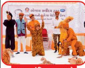
માનસ મંદિરના બાળકો