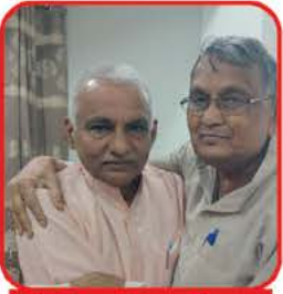
દો સિતારો કા મિલન