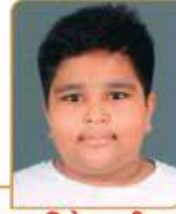
હિતાન્સ ચિતેસ કુલીન મુનવર ગામ : કોઠારા (વય : ૧૦) હાલ રહેઠાણ : ગાંધીધામ (કચ્છ)