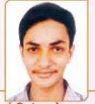
હેત નિકુંજ મહેન્દ્ર ગડા ગામ : વીઝાણા (વય : ૧૮) હાલ રહેઠાણ : કલ્યાણ (વે)