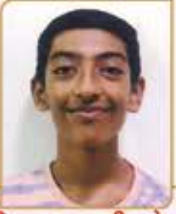
દિવ્ય તુષાર યતીશ છેડા ગામ : મોટી ઉનડોઠ (વય : ૧૬) હાલ રહેઠાણ : પરેલ