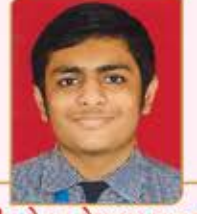
મીત કેતન કેશવજી સાવલા ગામ : રામાણીયા (વય : ૧૫) હાલ રહેઠાણ : મીરારોડ (ઈસ્ટ)