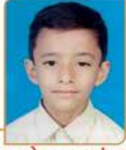
ધ્યાન કલ્વેશ પુશાલચંદ ગોસર ગામ : હમલા મંજલ (વય : ૧૨) હાલ રહેઠાણ : સાચન