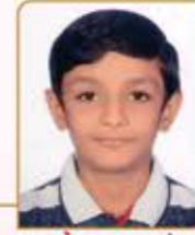
આશ્રય જ્યોતેન હરખચંદ પુથીયા ગામ : બેરાજા (વય : ૧૪) હાલ રહેઠાણ : નાની દમણ