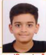
યુગ અંકિત વસંત વીરા ગામ : નાગલપુર (વય : ૧૧) હાલ રહેઠાણ : લોઅર પરેલ