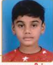
પુશ જુગર લક્ષ્મીચંદ ગાલા ગામ : વાંઢ (વય : ૧૦) હાલ રહેઠાણ : મણીનગર