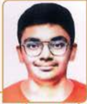
નીવ હારિક રમણીક દેઢિયા ગામ : ગઢશીશા (વય : ૧૩) હાલ રહેઠાણ : દહિસર (ઈસ્ટ)