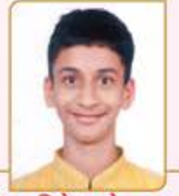
હેતવ નિતેશ નરેન્દ્ર ગાલા ગામ : ગોધરા (વય : ૧૩) હાલ રહેઠાણ : વરલી