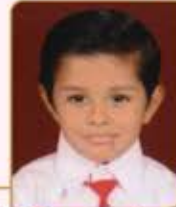
હીત નીરવ હરખચંદ છાડવા ગામ : મોટી ખાખર (વય : ૧૦) હાલ રહેઠાણ : વીરાર (વે)