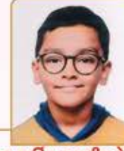
લવ હારેક રમણીક દેઢિયા ગામ : ગઢશીશા (વય : ૧૦) હાલ રહેઠાણ : દહિસર (વેસ્ટ)