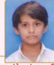
દક્ષ સંકેત ચંપક સાલિયા ગામ : નાની ખાખર (વય : ૧૨) હાલ રહેઠાણ : થાણા (વે)