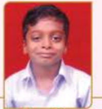
પ્રથમ રૂપેશ પ્રવિહા કુરિયા ગામ : તલવાણા (વય : ૧૫) હાલ રહેઠાણ : ઘોડપદેવ