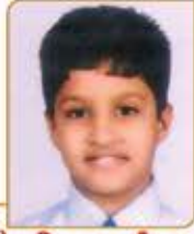
હેત વિપુલ રમણીક મારૂ ગામ : બિદડા (વય : ૧૪) હાલ રહેઠાણ : શિવરી