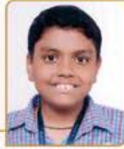
અધ્યાન જાલુબહુ જાધવ ગામ : રંગપુર (વય : ૧૦) હાલ રહેઠાણ : ભાંડુપ (વેસ્ટ)