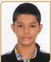
શાસન દિપેશ પ્રેમજી સંગોઈ ગામ : ભિંસરા (વય : ૧૬) હાલ રહેઠાણ : ભાચંદર (ઈસ્ટ)