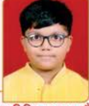
ભવ્ય તિમિર વ્રજલાલ બૌઆ ગામ : નાની તુંબડી (વય : ૧૩) હાલ રહેઠાણ : માટુંગા (ઈસ્ટ)