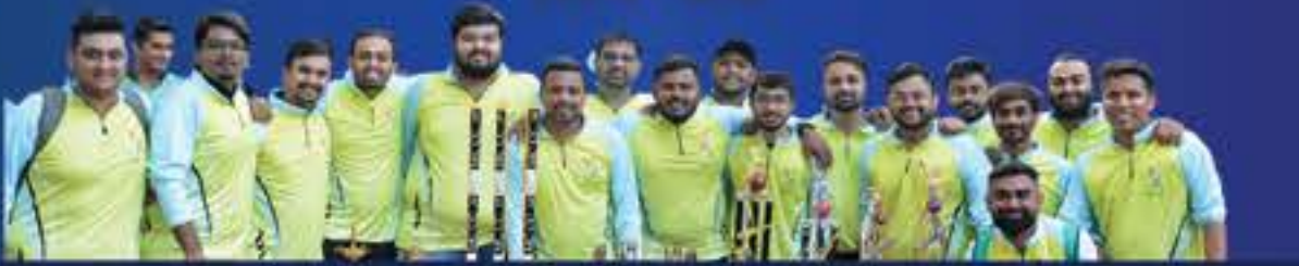
Event Concept Initiative & Event Managed By : Team MC CC