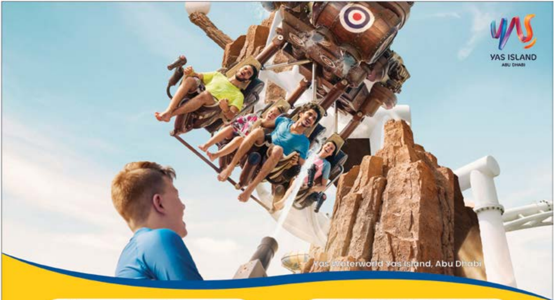
Yas Waterworld Yas Island, Abu Dhabi