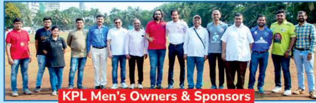
KPL Men's Owners & Sponsors

તમામ પ્રેક્ષકગણ, ભાગ લેનાર પ્લેયરો, ટીમ ઓનરો, કો-સ્પોન્સરો તથા નામી-અનામી પ્રત્યક્ષ કે પરોક્ષ રીતે સંપૂર્ણ દુનાર્થન્ટને સફળ બનાવવામાં યોગદાન આપનારા સર્વેનો ખરા દિલથી ખૂબ ખૂબ આભાર તથા અમારા વતી કોઈ ક્ષતિ થઈ હોય તો મિચ્છામિ દુઃસ્કન્ધ