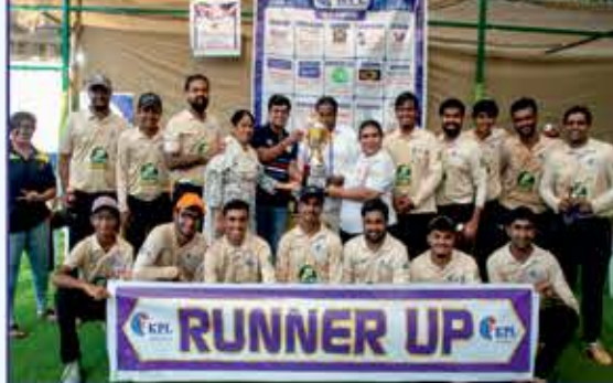
COCONUT KE HERO