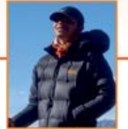
પંખીલ હરીશ છેડા (બિદડા) - ઉ. ૩૬

તા. ૪ એપ્રિલના પ્રયાણ કરી રહ્યા છે. આ ત્રણેય ક.વિ.ઓ. સાહસીઓને પ્રોત્સાહિત કરવા તથા સમાજમાં પર્વતારોહણ વિશે જાગૃતિ ફેલાવવા અને વિવિધ માહિતીનું આદાન પ્રદાન કરવા 'ફલેગ ઓફ સેરેમની' નું આયોજન કરવામાં આવેલ છે. સમાજમાં સર્વે રમતપ્રેમી, સમાજપ્રેમી અને ખેલદિલ વ્યક્તિઓને આ વિશિષ્ટ કાર્યક્રમમાં હાજરી આપવા સપ્રેમ નિમંત્રણ.