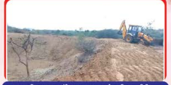
લક્ષ્મીસાગર જલમંદિર તળાવના ખાણેત્રાની કામગીરી, માળી સફાઈનું કાર્ય, તળાવના પાણીનું નુતનીકરણ અને પાણીના ઘેરાવાનો વિસ્તાર મોટો કરવાની સુંદર કામગીરી કરેલ છે.