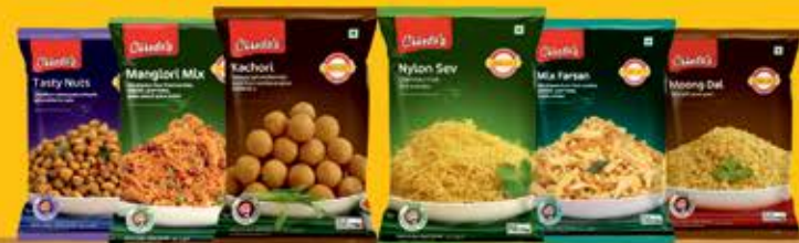
Indian Traditional Snacks