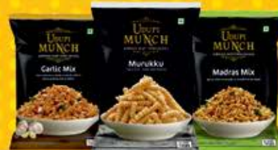
South Indian Snacks