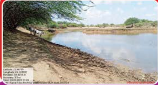
પતરાઈ તળાવ ઉંડો કરાવી આપ્યો.