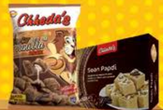
Cream Filled Snacks & Soan Papdi