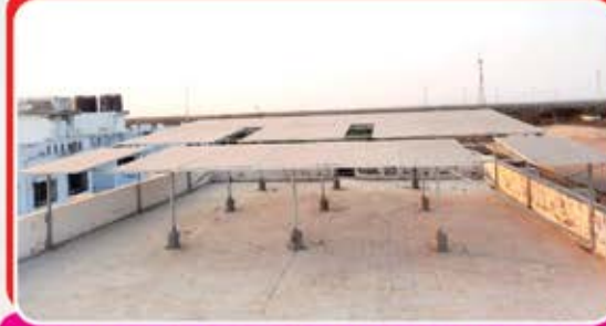
સંકુલમાં સોલાર સિસ્ટમ બેસાડી આપી