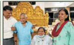
December 2023 CST to Panvel