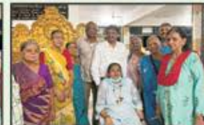
January 2024 Bhiwandi Resident