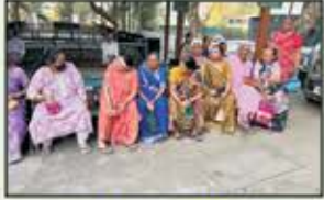
March 2023 CST to Panvel Resident