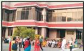
August 2023 Virar to Vapi Resident