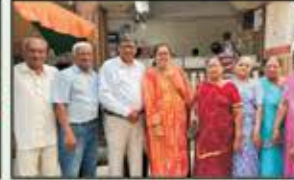
January 2023 Mulund Resident