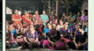
January 2023 Dombivali Resident