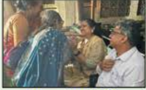
December 2022 Prabhadevi Resident