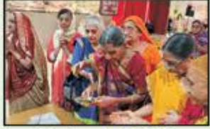
September 2022 Full Mumbai Resident