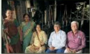
December 2022 Nallasopara Resident