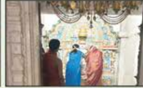
May 2023 CST to Kalyan