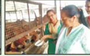
December 2022 Kandivali Resident