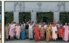
April 2024 Resident Western Line