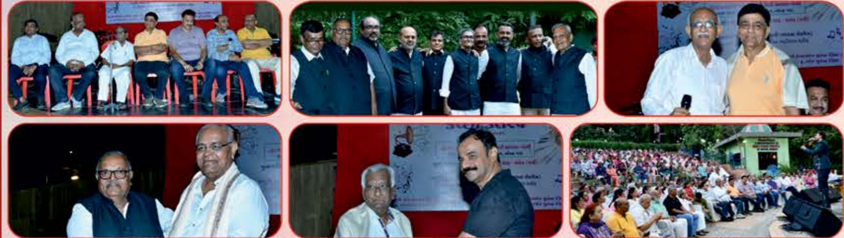
આખરમા સહુથી જરૂરી એવા સમગ્ર મુંબઈ માંથી આવેલે ૭૦૦ થી વધુ ક.વિ.ઓ વ્યક્તિઓ જેમની હાજરીથી આ કાર્યક્રમમાં ચાર ચાંદ લાગી ગયા.