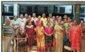
Feb 2024 Resident Virar to Vapi