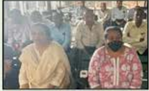
February 2023 Bhiwandi Resident