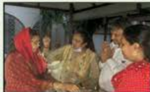
November 2023 CST to Kalyan Resident