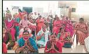
January 2023 Ghatkopar Resident