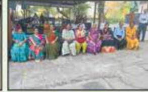
June 2023 CST to Panvel Resident