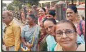
December 2022 Dahisar Resident