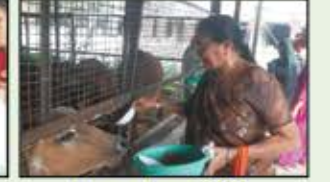
December 2022 Borivali Resident