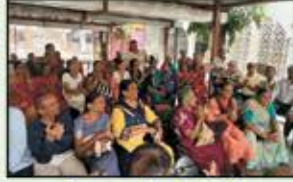
December 2022 Khar Resident