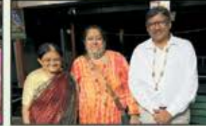
January 2023 Thane Resident