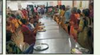
July 2023 Bhiwandi Resident