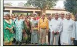
December 2022 Jogeshwari Resident