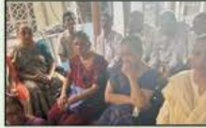
April 2023 Churchgate to Virar Res.