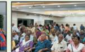
May 2024 : CST to Kalyan (Center Line)