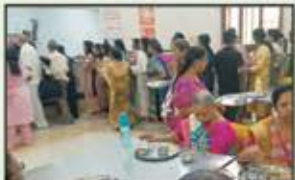
October 2023 Churchgate to Virar Resident