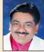
ભીમશી કરસન સત્રા-સુવર્ણ