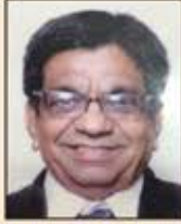
દામજી જુઠાલાલ સત્રા-સુવર્ણ

: કાર્યક્રમમાં અતિથિ વિશેષનું સ્થાન શોભાવશે :