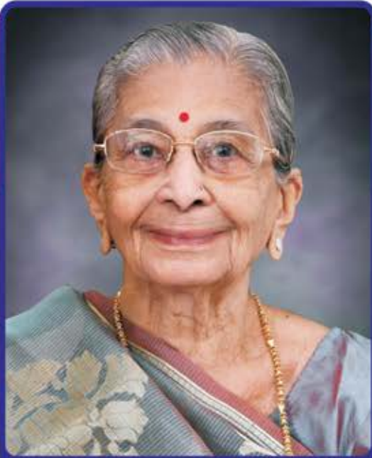
યક્ષુદાન-ત્વચાદાન કરેલ છે.

કરછ : નાગલપુર પ્રાર્થના સભા મુંબઈ : કિલાઈલ રોડ