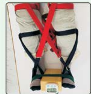
Osteoarthritis of Knee

અત્યાર સુધી ૧૫,૦૦૦ થી વધુ પેશન્ટ્સની સફળ ટ્રીટમેન્ટ થઈ છે