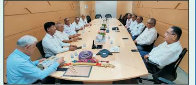
વતનને નવપલ્લીત કરવા માટેની ચર્ચા-વિચારણા