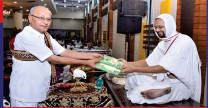
ત્રીજી આવૃત્તિનાં વિશેષ પ્રસન્ને ભુજ નિષ્ઠા

પ્રથમ આવૃત્તિની ૫૦૦૦ નક્કલ ગણત્રીના દિવસોમાં જ પૂર્ણ થતાં બીજી આવૃત્તિ પ્રકાશિત કરવામાં આવેલ દ્વિતીય આવૃત્તિ પણ ગણત્રીનાં દિવસોમાં પૂર્ણ થતાં તૃતીય આવૃત્તિ પ્રકાશન કરવામાં આવેલ છે. પ્રથમ આવૃત્તિના પ્રકાશનમાં અને દ્વિતીય આવૃત્તિના પ્રકાશનમાં તેમજ તૃતીય આવૃત્તિનાં પ્રકાશનમાં વિવિધ ભાગ્યશાળી પરિવારો તરફથી અનુદાન પ્રાપ્ત થયેલ છે. તેઓની અંતરથી અનુમોદના કરીએ છીએ. પ્રથમ અને દ્વિતીય આવૃત્તિનાં સાભારી પરિવારોની નામાવલી દ્વિતીય આવૃત્તિમાં આપવામાં આવેલ છે. તૃતીય આવૃત્તિનાં સાભારી પરિવારોની નામાવલી આ પુસ્તકમાં આપવામાં આવેલ છે. પ્રથમ આવૃત્તિ તેમજ દ્વિતીય આવૃત્તિનું પુસ્તક લેનાર ભાગ્યશાળીઓ તરફથી આ પુસ્તક માટે ખૂબજ સરસ ફીડબેક પ્રાપ્ત થયેલ છે. જેથી તરત જ ત્રીજી આવૃત્તિની ૫૦૦૦ નક્કલ પ્રકાશિત કરેલ છે. અમે આશા રાખીએ છીએ કે દરેક પરિવારો "સમાધિની સાધના" પુસ્તકની એડ એડ નક્કલ વસાવી લેજો. સૌને ખૂબજ ઉપયોગી બનશે એવી અમને ખાત્રી છે.