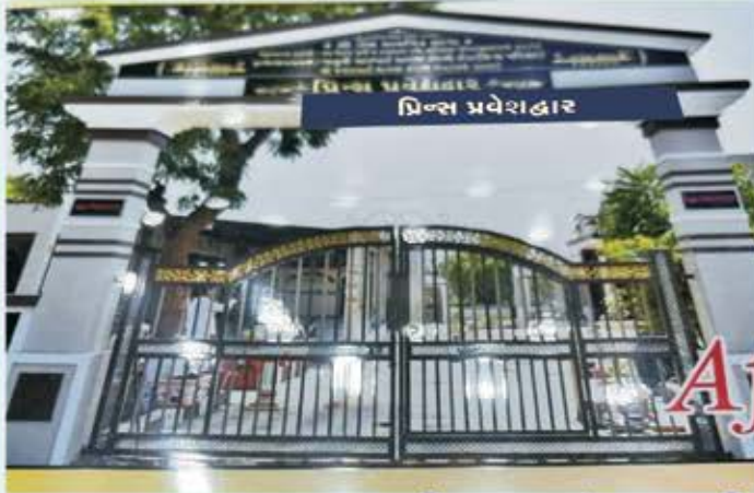
ગામની શાળાનું આધુનીકરણ