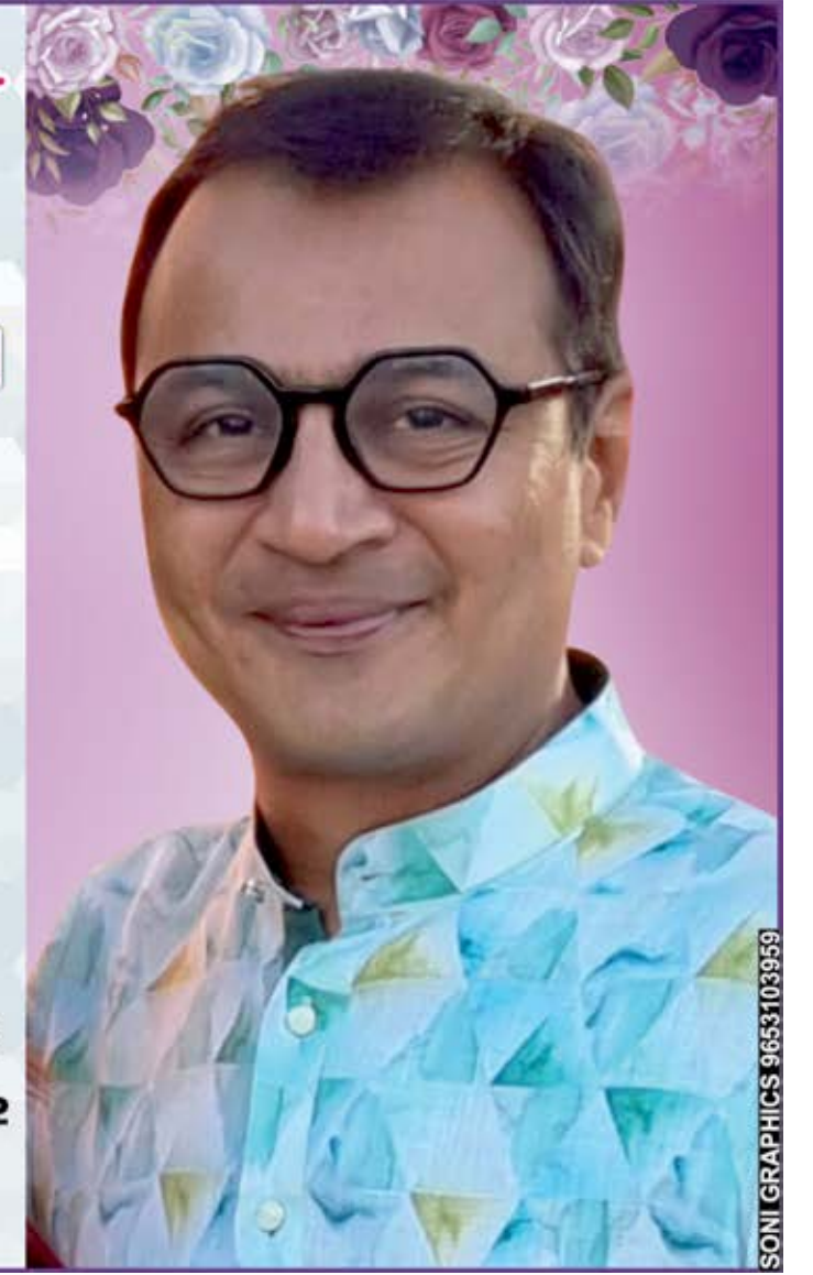
SONI GRAPHICS 9653103959