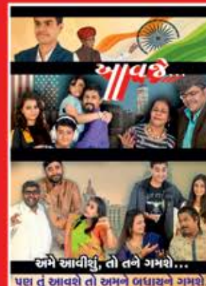
અમે આવીશું, તો તને ગમશે... પણ તું આવશે તો અમને બધાચને ગમશે.