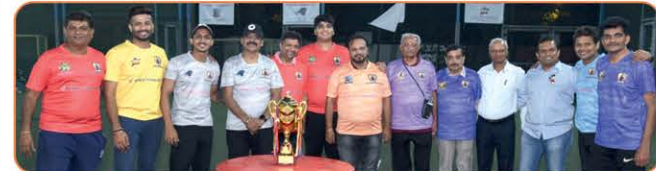
Team Owners - 'sUccess can't be spell without U'