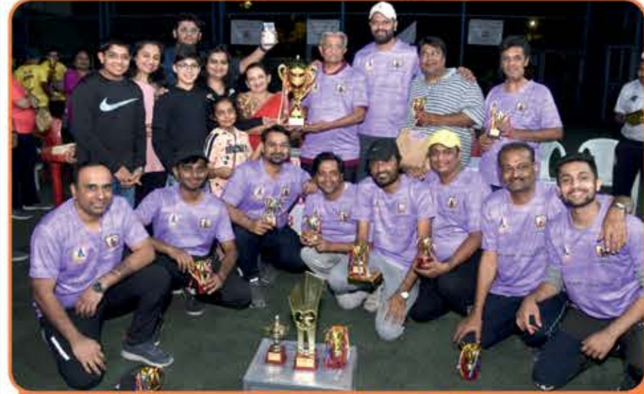
Winner - Premier Blasters ઓનર - મણીલાલ ભેદા

સર્વે ગામવાસીઓનો આભાર સર્વે ખેલાડીઓનો આભાર