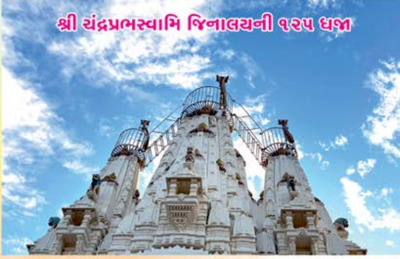
શ્રી ચંદ્રપ્રભસ્વામિ જિનાલયની ૧૨૫ ધજા