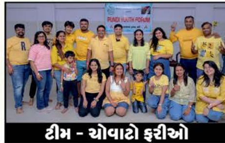
ટીમ - ચોવાટો ફરીઓ