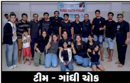
ટીમ - ગાંધી ચોક