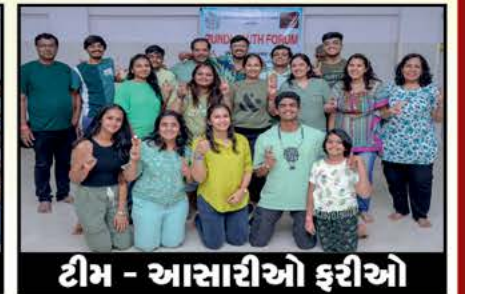
ટીમ - આસારીઓ ફરીઓ

આભાર ગેમ્સ ઓર્ગેનાઈઝર: શશીન દિપક શાહ (ગામ લાખાપર) ✪ ફોટોગ્રાફર: ધવલ અશોક છેડા (ગામ પુનડી)