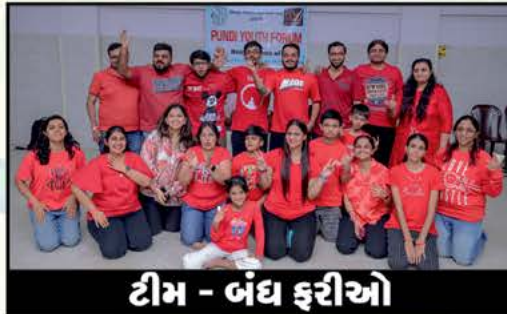
ટીમ - બંધ ફરીઓ