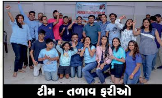
ટીમ - તપાવ ફરીઓ