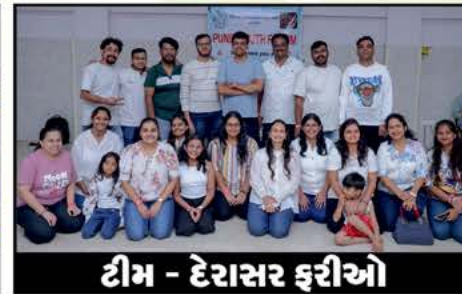
ટીમ - દેરાસર ફરીઓ