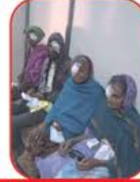
પાટો ખોલો નવી આંખે દુનિયા ખેવી છે