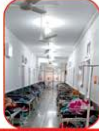
સફળ ઓપરેશન પછીની નિરાંતની ઉંઘ