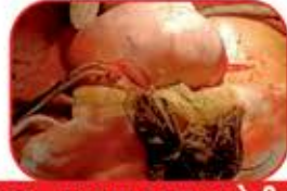
અધધ...આટલા કચરા સાથેની ગાંઠ