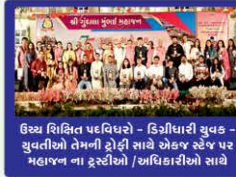
ઉચ્ચ શિક્ષિત પદવિધારો - ડિઝીટાલી યુવક - યુવતીઓ તેમની ટ્રોફી સાથે એકજ સ્ટેજ પર મહાજન ના ટ્રસ્ટીઓ / અધિકારીઓ સાથે