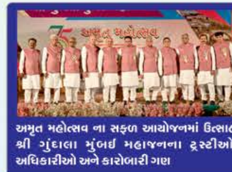
અમૃત મહોત્સવ ના સફળ આયોજનમાં ઉત્સાહી શ્રી ગુંદાલા મુંબઈ મહાજનના ટ્રસ્ટીઓ, અધિકારીઓ અને કારોબારી ગણ