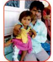
હું હવે મારા પગ ઉપર ઉભી રહીશ