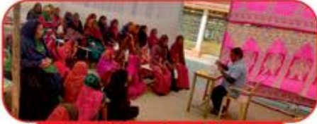
મહિલાઓને આરોગ્ય અંગે સમજ