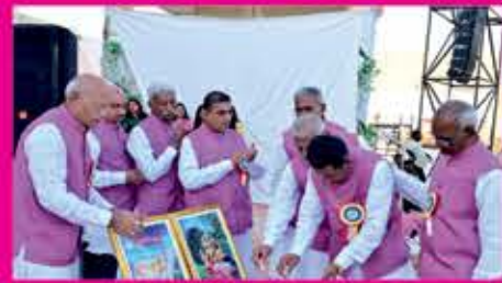
દીપ પ્રજ્વલન કરતા મહાજનના પ્રમુખશ્રી અને ટ્રસ્ટી - અધિકારીઓ

શ્રી ગુંદાલા મુંબઈ મહાજનના ૭૫ વર્ષની પૂર્ણાહુતિ પ્રસંગે રવિવાર તા.૧૨/૦૨/૨૦૨૩ના અમૃત મહોત્સવનું ભવ્ય આયોજન બોરીવલીના કચ્છી ગ્રાઉન્ડમાં સંપન્ન થયું. આ અમૃત મહોત્સવમાં ગામવાસીઓ, નિયાણી બહેનો તથા અમંત્રિત સંસ્થાઓના ટ્રસ્ટી-અધિકારીઓ ઉત્સાહ પૂર્વક સહભાગી થઈ આ ભવ્ય આયોજનને ઉમળકાભેર માણ્યો.