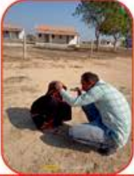
છેવાડેનું ગામ - છેવાડેનો દરદી

૩૨ મા મેગા મેડીકલ કેમ્પની સમાપ્તિ પછી ભોજય સર્વોદય ટ્રસ્ટની બધી પ્રવૃત્તિઓ નિયમિત રૂપે ચાલે છે. વિવિધ પ્રવૃત્તિઓ માટે અનુદાતાઓની સરવાણી વહેતી રહે છે. જેની યાદી સમયાંતરે પ્રસિધ્ધ થતી રહે છે.