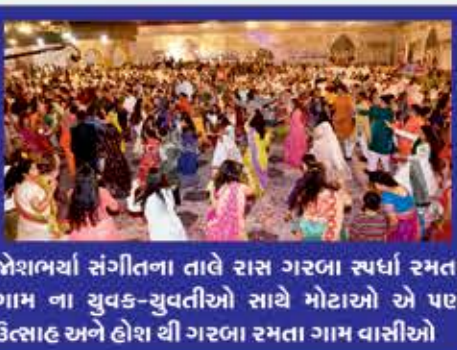
જોશભર્યા સંગીતના તાલે રાસ ગરબા સ્પર્ધા રમતા ગામ ના યુવક-યુવતીઓ સાથે મોટાએ એ પણ ઉત્સાહ અને હોશ થી ગરબા રમતા ગામ વાસીઓ