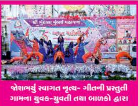
જોશભર્યું સ્વાગત નૃત્ય- ગીતની પ્રસ્તુતી ગામના યુવક-યુવતી તથા બાળકો દ્વારા

મહોત્સવના રૂ.૨૫૦૦/-ના એક કુપનના સહયોગી દાતા પ્રમાણેના કુલ ૫૦ કુપનના દાતાશ્રી