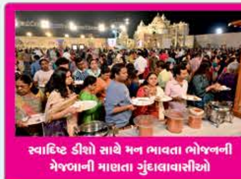
સ્વાસ્થિ કીશો સાથે મન ભાવતા ભોજનની મેજબાની માણતા ગુંદાલાવાસીઓ