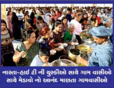
નાસ્તા-હાઈ ટી ની ચુસ્તીઓ સાથે ગામ વાસીઓ સાથે મેડાવો નો આનંદ માણતા ગામવાસીઓ