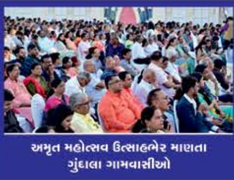
અમૃત મહોત્સવ ઉત્સાહભેર માણતા ગુંદાલા ગામવાસીઓ