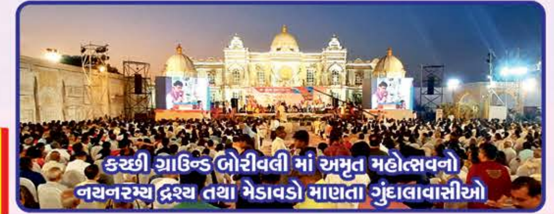
કચ્છી ગ્રાઉન્ડ બોરીવલી માં અમૃત મહોત્સવનો નયનરમ્ય દ્રશ્ય તથા મેડાવડો માણતા ગુંદાલાવાસીઓ