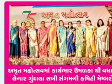
અમૃત મહોત્સવમાં કાર્યભાર ઉમળકા થી વધારી લેનાર ગુંદાલા સખી સંગમની કમિટી મેમ્બરો