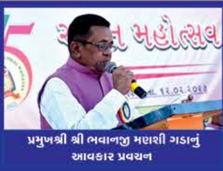
પ્રમુખશ્રી શ્રી ભવાનજી મહાશી ગડાનું આવકાર પ્રવચન