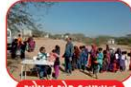
ઓપન એર દવાખાનું