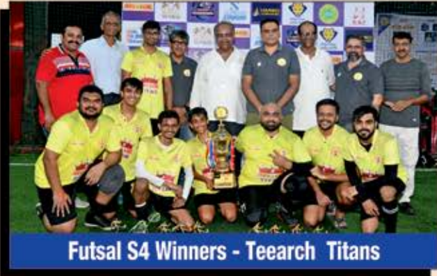
Futsal S4 Winners - Teearch Titans