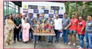
Team Borivali Mahajan