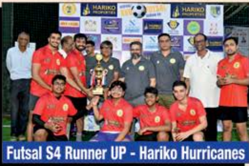
Futsal S4 Runner UP - Hariko Hurricanes