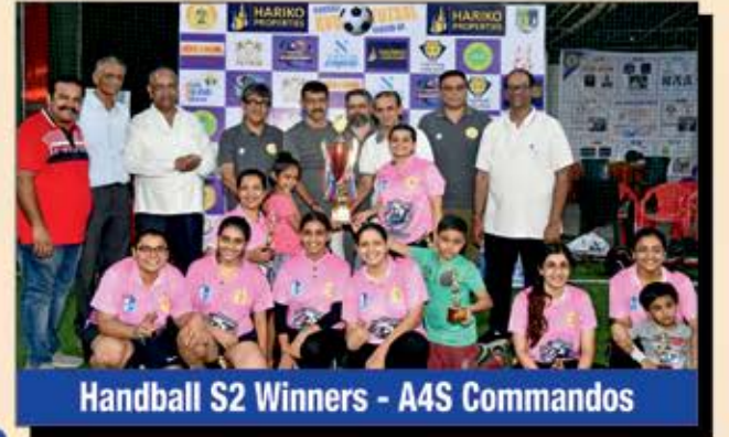
Handball S2 Winners - A4S Commandos