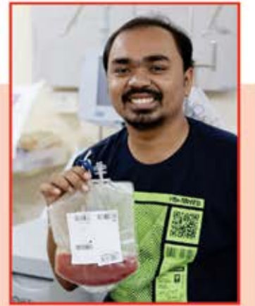
લિ. : તરુણ પરિવાર