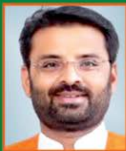
વિનોદ થાવડા (સાંસદ)