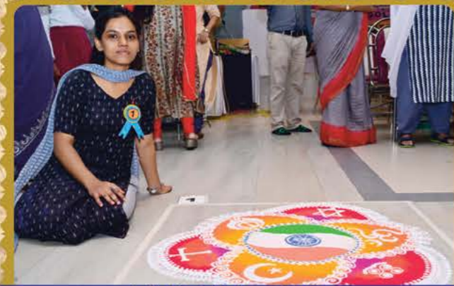
રંગોળીમાં વિજેતા શિક્ષિકા