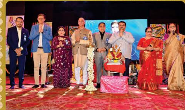
દિપ પ્રાગટ્ય કરતા ઉપસ્થિત ટ્રસ્ટીગણો