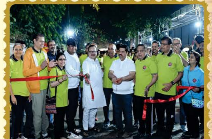
મેરેથોન દોડના ઉદ્ઘાટન પ્રસંગે અતિથિ વિશેષ