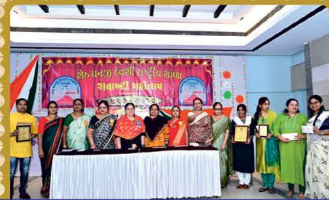
પ્રતિભા કાવ્યાંગમાં હાજર નિર્ણાયક ગણ