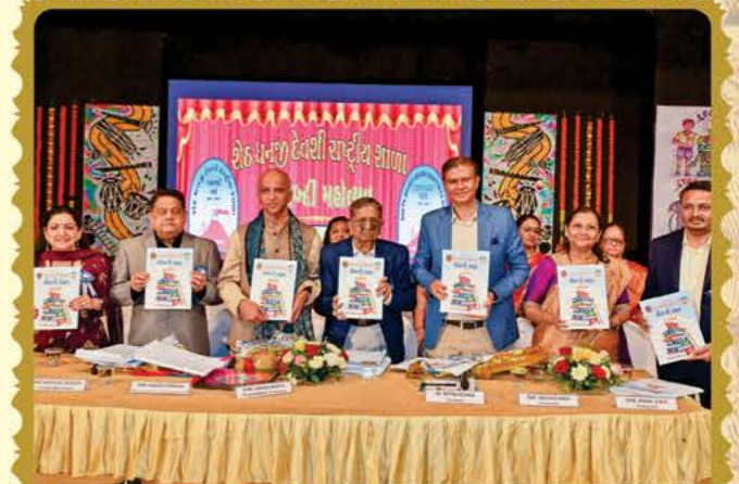
સૈકાની સફર સોવિનીયરનું વિમોચન કરતા માન્યવર