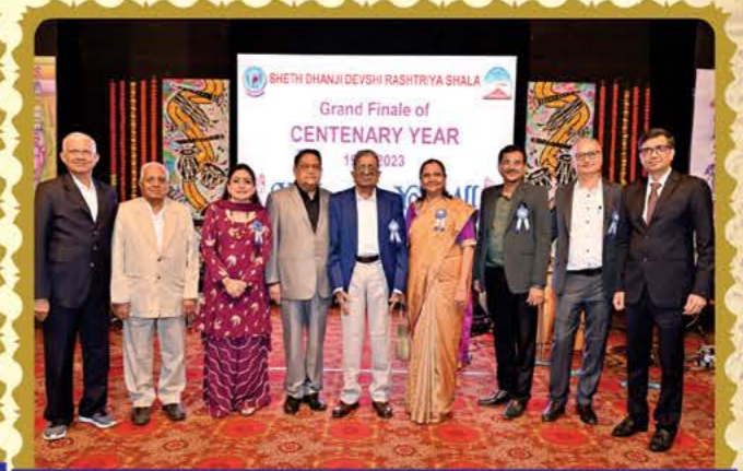
શૈઠ ધનજી દેવશી રાષ્ટ્રીય શાળાના અધિકારીગણો