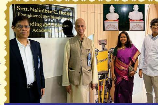
રોબોટિક્સ સેન્ટરના ઉદ્ઘાટન પ્રસંગે