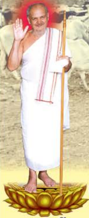
તપચકચકવર્તિ, અચલગચ્છાધિપતિ પ.પૂ.આ.ભ.