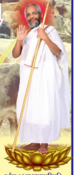
વર્તમાન અચલગચ્છાધિપતિ પ.પૂ.આ.ભ.