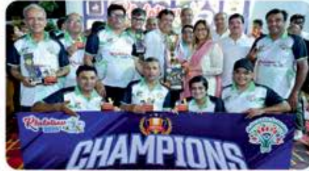
Legends : RC Challenger