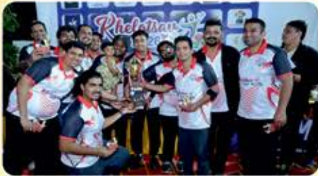
Male : Chheda Champions