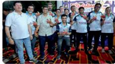
Legends : Herotex Hurricane