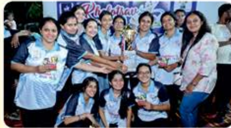
Female : Chheda Thunderbolts