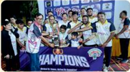
Male : Kwalitiy Kings