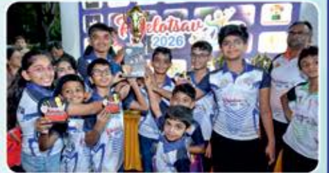
Kids : MAYC