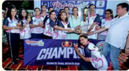
Female : Jalsa