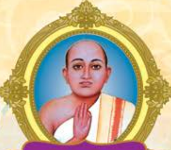
આધ દાદા ગુ. ગચ્છ પ્રવર્તક પૂ. આર્યરક્ષિતસૂરિજી મ.સા.