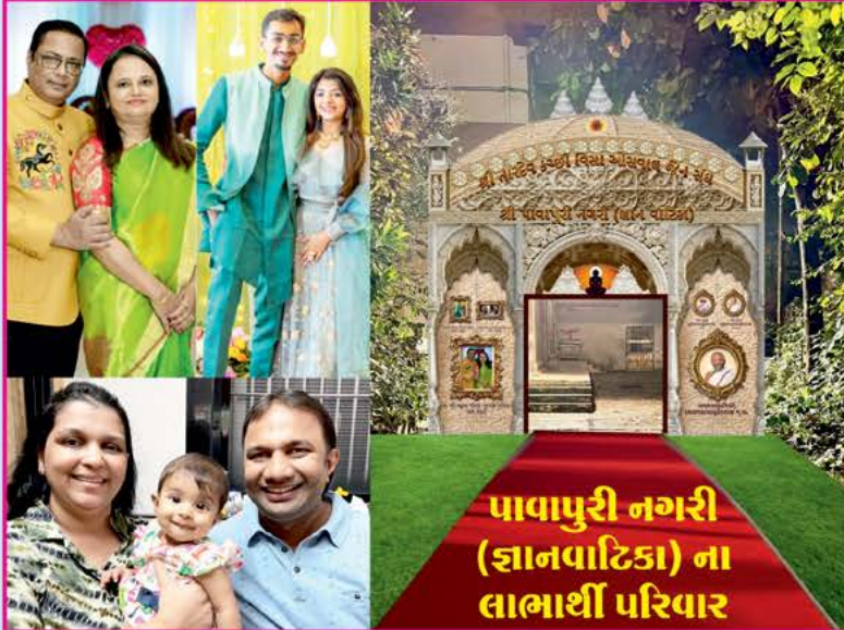
પાવાપુરી નગરી (જ્ઞાનવાટિકા) ના લાભાર્થી પરિવાર

પર્યુષણ પર્વની પ્રથમ દિવસે શનિવાર, તા. ૩૧-૮-૨૪ ના પાવાપુરી નગરી જ્ઞાનવાટિકાનું પૂજ્ય શ્રમણ ભગવંતોની પાવનકારી નિશ્રામાં દાતા પરિવારના હસ્તે સવારે ૮.૩૦ કલાકે ઉદ્ઘાટન