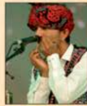
ખેરાજ સાયા મોરચંગ