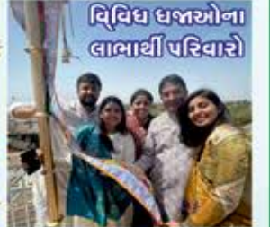
વિવિધ ધજાઓના લાભાર્થી પરિવારો