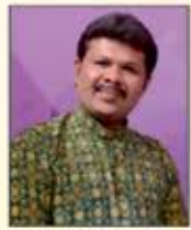
અલતાફ મીર ગાયક