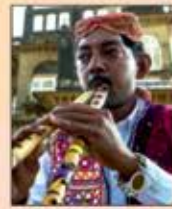
અમજદ સોટા જોડીયા પાવા