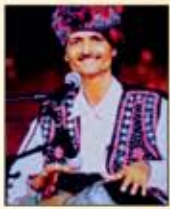
દાના ભારમલ ગાયક - ઘડો ગંભીલો