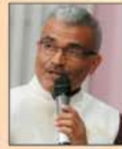
નારાણ ગઢવી પ્રવક્તા