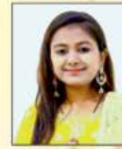
અલવીના મીર ગાયીકા