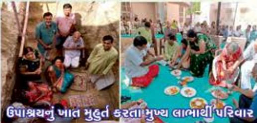
ઉપાશ્રયનું ખાત મુહુર્ત કરતા મુખ્ય લાભાર્થી પરિવાર